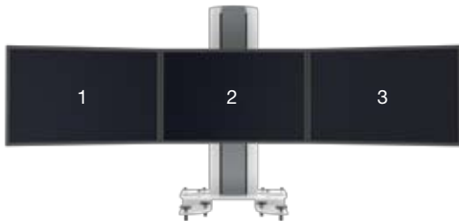
SMS Multi Control Triple Clamp