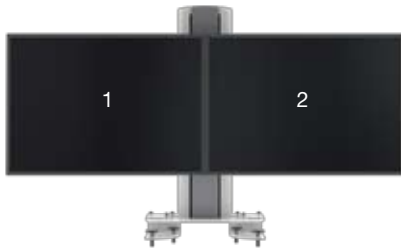
SMS Multi Control Dual Clamp