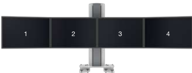
SMS Multi Control Quad Clamp