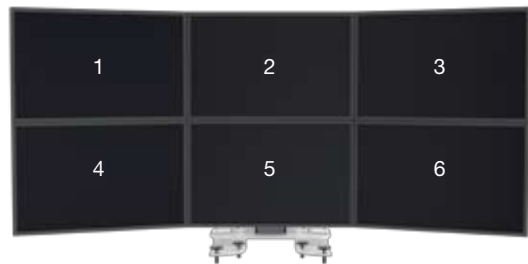
SMS Multi Control 2xTriple Clamp