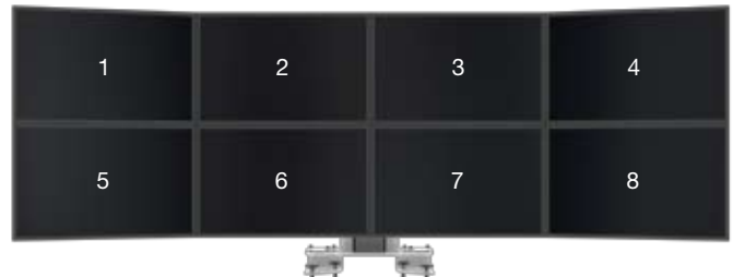
SMS Multi Control 2xQuad Clamp