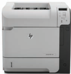
HP LaserJet Enterprise 600 M601dn