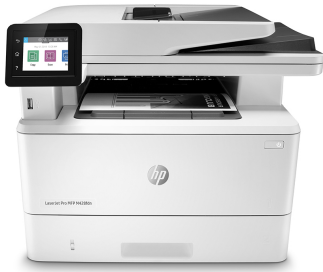
HP LaserJet Pro MFP M428fdn

Goda resultat kräver smartare arbete. HP LaserJet Pro MFP M428 är utvecklad för att ni ska kunna lägga tid på sådant som hjälper företaget att expandera effektivt och ligga steget före konkurrenterna.