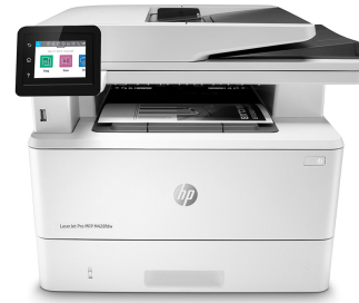
HP LaserJet Pro MFP M428fdw

Dynamisk säkerhetsaktiverad skrivare. Endast avsedda att användas med patroner/kassetter som har ett äkta HP-chip. Patroner/kassetter som har ett chip som inte är från HP kanske inte fungerar, och de som fungerar idag kanske inte fungerar i framtiden. Läs mer på: http://www.hp.com/go/learnaboutsupplies