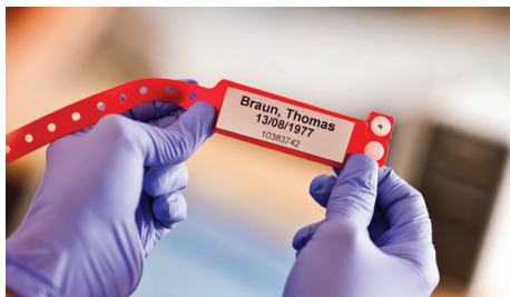
Skriv ut viktiga patientuppgifter vid behov