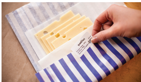
Försäkra tryggheten för dina kunder genom att tydliggöra "bäst före" datum