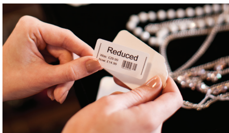
Gör enkelt nya prislappar i samband med utförsäljning