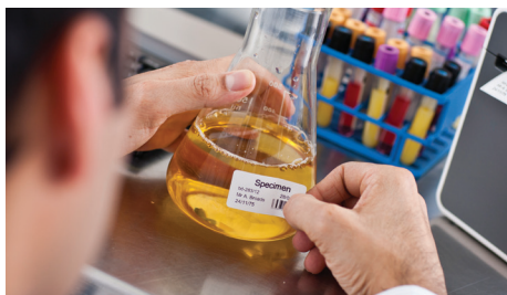
Säkerställ att patienternas prover tydligt och enkelt kan identifieras