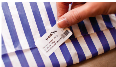
Limmet som används i Brother RD-rullar har certifierats för säker livsmedelsmärkning