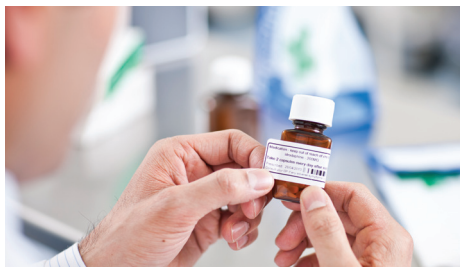
Etikettstorlekarna kan anpassas för att passa olika typer av burkar/flaskor

Nätverksmodellerna (2120N & 2130N) ger vårdpersonal möjlighet till trådlösa utskrifter, av en mängd olika streckkodsetiketter snabbt och vid behov, i laboratoriet, apoteket, receptionen eller vid patientens säng. Med stöd för de vanligaste streckkoderna är alla modellerna idealiska för alla typer av märkningsbehov inom vården.