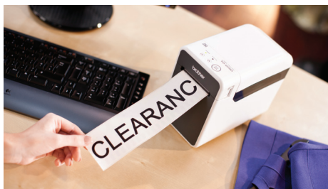
Etiketter i löpande längd ger möjlighet att snabbt göra större skyltar

Öka produktiviteten och effektiviteten med möjligheten att skriva ut flera olika etiketter runt om på arbetsplatsen genom att ställa TD-2000 på en vagn/mobil arbetsstation. Med dess kompakta design är TD-2000 perfekt att använda på trånga arbetsutrymmen eller små arbetsdiskar. Skarp text, loggor och streckkoder som skrivs blir snabbt utskrivna i hög kvalitet.