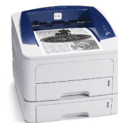
Phaser 3250 med Tillvalsmagasin 2