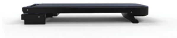
Neutralt upphöjt läge