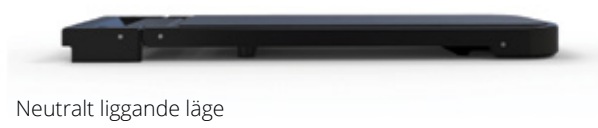
Neutralt liggande läge