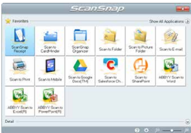
Het snelkeuzemenu voor Mac OS bevat andere toepassingen