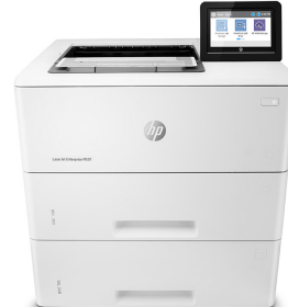
HP LaserJet Enterprise M507x

Dynamisk säkerhetsaktiverad skrivare. Endast avsedda att användas med patroner/kassetter som har ett äkta HP-chip. Patroner/kassetter som har ett chip som inte är från HP kanske inte fungerar, och de som fungerar idag kanske inte fungerar i framtiden. Läs mer på: http://www.hp.com/go/learnaboutsupplies