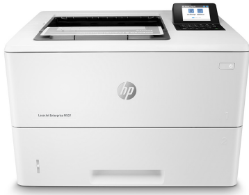
HP LaserJet Enterprise M507dn

Välj en HP LaserJet Enterprise-skrivare som är utformad för säker och effektiv hantering av företagslösningar och som hjälper till att spara energi med HP EcoSmart - svart toner. Häng med i takten på ert växande företag med en skrivare som ni kan lita på. 1