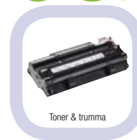
Toner &amp; trumma